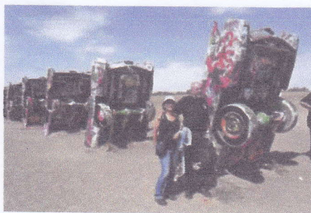
I likhet med Bruce Springsteen lot altaværingene seg imponere over Cadillac Ranch, der gamle Cadillacer har blitt kunstverk ved å bli gravd halvveis ned i jorda.