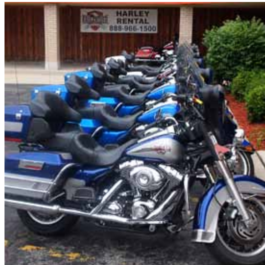
KROM. Harley Davidson-sykler på rekke og rad før start – et imponerende syn.