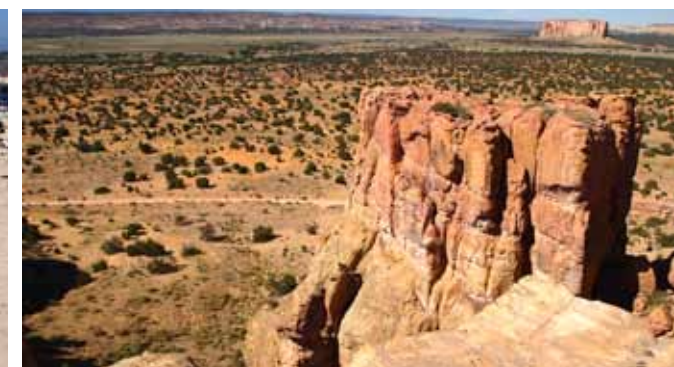
GRAND CANYON. Guds eget underverk er nasjonalparken Grand Canyon kalt. Et vakkert skue!