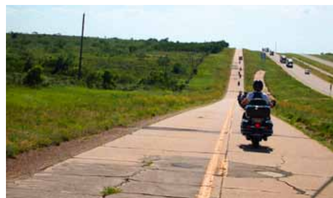
LANGT. Vi kjører på den «opprinnelige» Route66 med Interstate-motorveien ved siden av – og veistrekkninger så lang som øyet kan se.