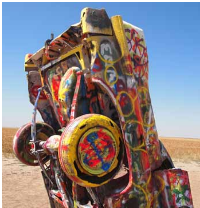
BILKUNST. Ti Cadillac'er med hodet i sanden! På veien mot Los Angeles stopper vi og nyter synet av kunstverkene – de gamle cadillacene som ser ut som om de er kommet fra himmelen og som folk kan spraylakkere og skrive sine navn på.

setter vi vår lit til at dette munnhullet er riktig. Vi stopper ofte og drikker mye, slår av en prat og utveksler erfaringer. Det er på disse rastene at kjennskap og vennskap oppstår. At vi i gruppen deler og knytter bånd.