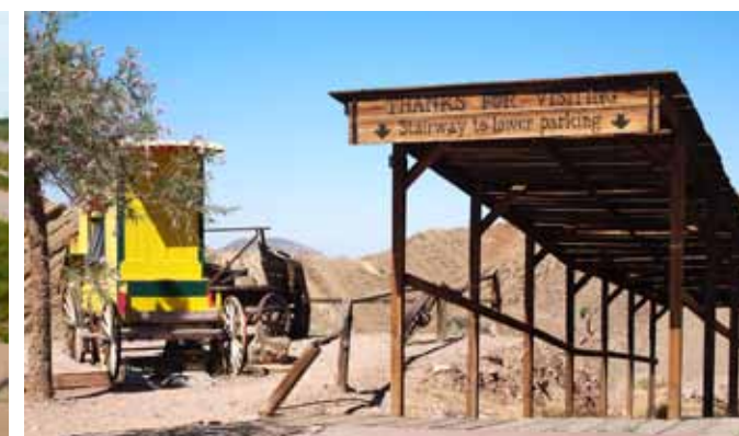
GRUBEVY. Ulike opplevelser og stopp underveis gir nødvendige avbrekk i kjøringen. Her fra en nedlagt gruveby i ørkenen.