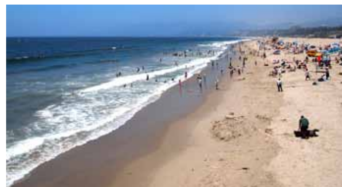
SANTA MONICA. Den kjente stranden i Los Angeles som du bare «må» oppleve. Her er blant annet filmen Baywatch spilt inn.