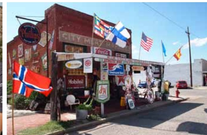
SUVENIRER. En typisk butikk langs ruten. Fylt opp av suvenirer, gamle skilt og krimkrams.